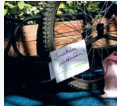
Pekka Mäkinen 2009

Essi Kausalainen esiintyi ANTI-festivaalilla ensimmäisen kerran vuonna 2002. Essi Kausalainen first performed at ANTI during the 2002 edition.